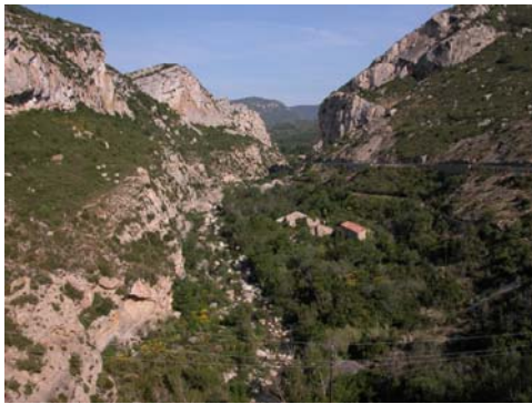
Gorges de Padern (Corbières)