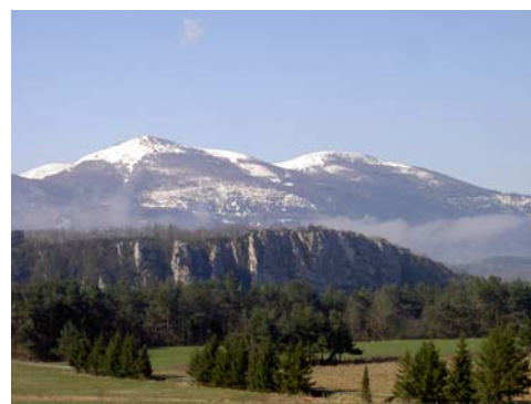
Massif de l'Ourtiset (Pyrénées-Audoises)