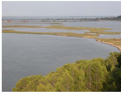
Lagune de Bages-Sigean (littoral)

Une Sarcelle d'hiver sur une petite zone humide à Montsérét le 17 juin (maille E10 ; CV), individu estivant (... blessé ?) ou nicheur potentiel ...?